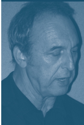
Guillermo Vázquez Consuegra Edificio per Case Popolari Rota (Cadice) – Spagna

L'edificio di Case popolari progettato in un'area di espansione al nord di Rota (Cadice) è risultato vincitore di un concorso nazionale bandito dalla Junta de Andalucía. Si tratta di un blocco composto da 90 appartamenti che occupa il lotto terminale di un insediamento di residenze a basso costo regolato da un piano particoloreggiato che prevedeva una conformazione a patio per gli isolati che lo costituivano.