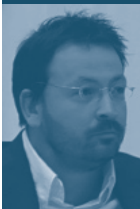
Kis Péter Építészműterme Pràter Street Social Housing Budapest – Ungheria

L'edificio è inserito all'interno del denso tessuto residenziale del secolo scorso della città di Budapest assumendo la scala e gli allineamenti degli edifici circostanti come tema di progetto. Il proposito esplicito di non imporre la propria presenza in maniera evidente sulla cortina edilizia, composta da edifici di minore dimensione rispetto alla parcella di progetto, è affrontato attraverso la frammentazione dell'intervento in due differenti volumi. Questi, da un lato si appoggiano al muro tagliafuoco seguendo la forma dell'edificio confinante, dall'altra completano con un nuovo quarto lato una corte interna all'isolato. La facciata del corpo più lungo è arretrata rispetto al filo stradale in modo da lasciare un generoso spazio pubblico alla città. Il varco tra i due corpi si apre sul giardino interno, permettendo la vista dei grandi alberi dal marciapiede esterno. I due volumi sono tra loro collegati da esili ponti in cemento, che continuano ai diversi piani i ballatoi interni e divengono l'elemento caratterizzante l'intero intervento.