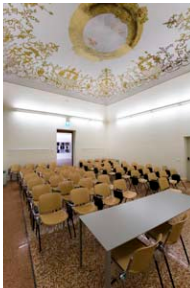
Spazi di accoglienza e didattica di Palazzo Tassoni.