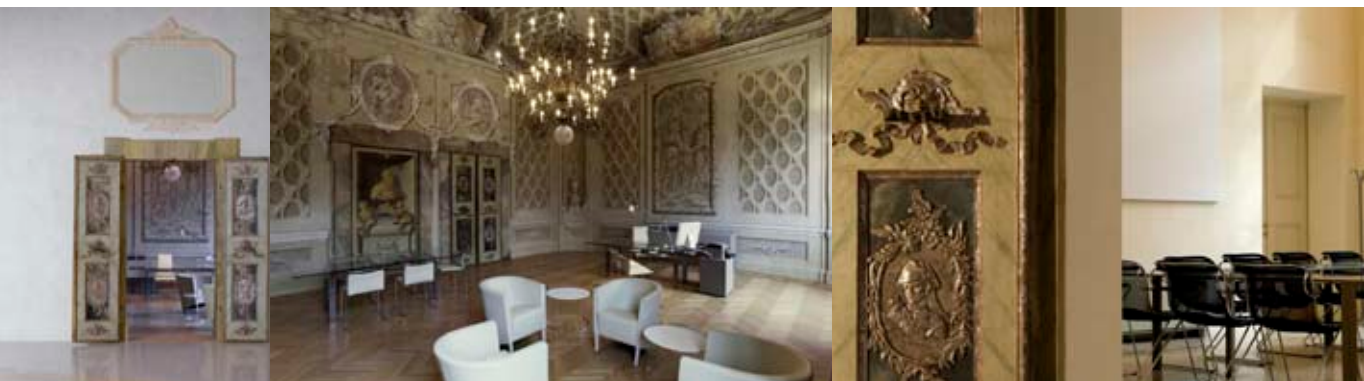
Spazi della Presidenza e della Sala Consiglio di Palazzo Tassoni.

Attraverso una serie di iniziative universitarie rivolte all'esterno della comunità accademica ferrarese si intende organizzare, lungo il 2010, percorsi didattici specialistici, eventi e manifestazioni (convegni, corsi di formazione, conferenze, mostre, premi di architettura e design, workshop a tema) capaci di creare un clima partecipato, coinvolgente e preparatorio alla celebrazione dei vent'anni di vita della Facoltà di Architettura di Ferrara da svolgersi nel 2011 attraverso la riedizione del fortunato evento del Decennale di fondazione (Xfaf) riproposto attraverso l'aggiornamento del suo acronimo in XfafX.