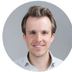
Leopold von Bismarck