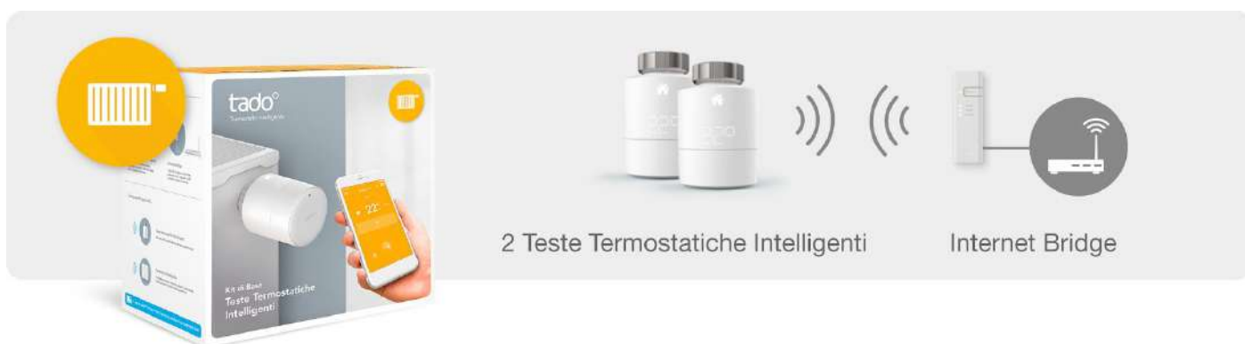
2 Teste Termostatiche Intelligenti

Termostato Intelligente Kit di Base Ideato per case con riscaldamento autonomo, con caldaia a gas, o centralizzato, con caldaia o pompa di calore, e riscaldamento a pavimento. Gestisce il tuo impianto di riscaldamento sostituendo il termostato ambiente cablati o wireless tramite Kit di Estensione (accessorio).