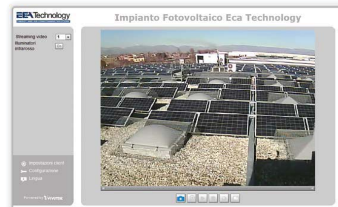
esempio di monitoraggio tramite webcam