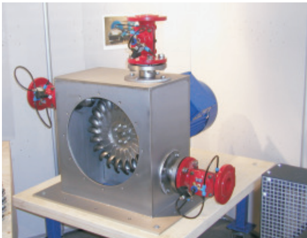
Turbine tipo Pelton con tre iniettori fissi - generatore asincrono 15 KW - 1500 g/m.