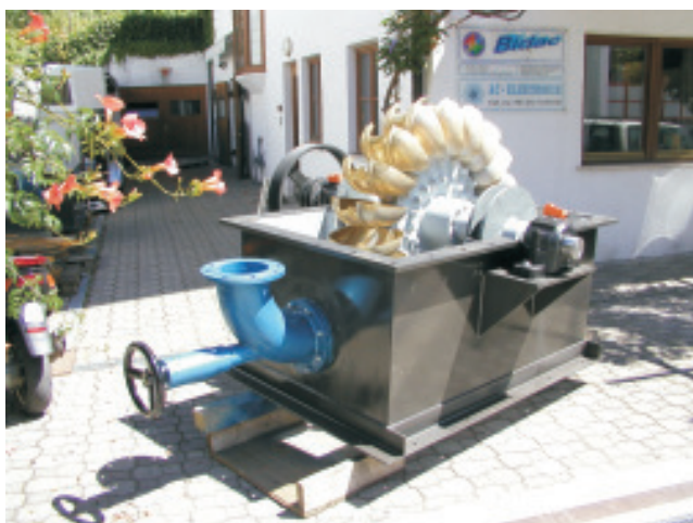
Turbine tipo Pelton con due iniettori 28 m dislivello - 300 l/s. - 60 KW