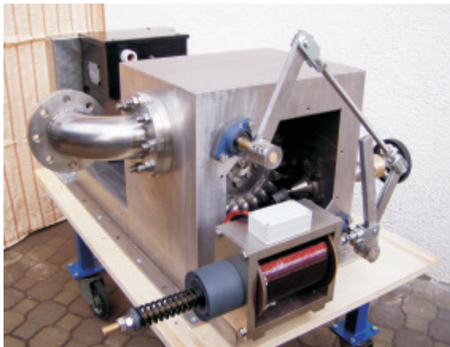
Turbine tipo Pelton con gen. sincrono 25KVA 1500 g/min. - 120 m dislivello