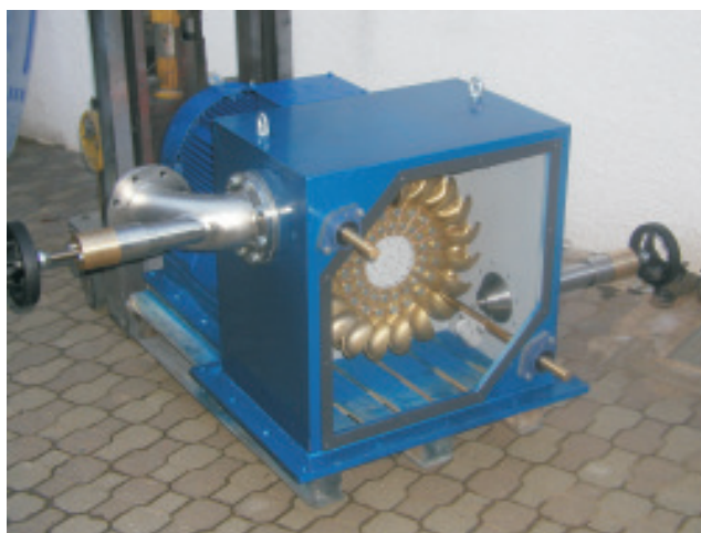
Turbine tipo Pelton con gen. sincrono 40 KW 750 g/min. - 66 m dislivello - 2x33 l/s portata