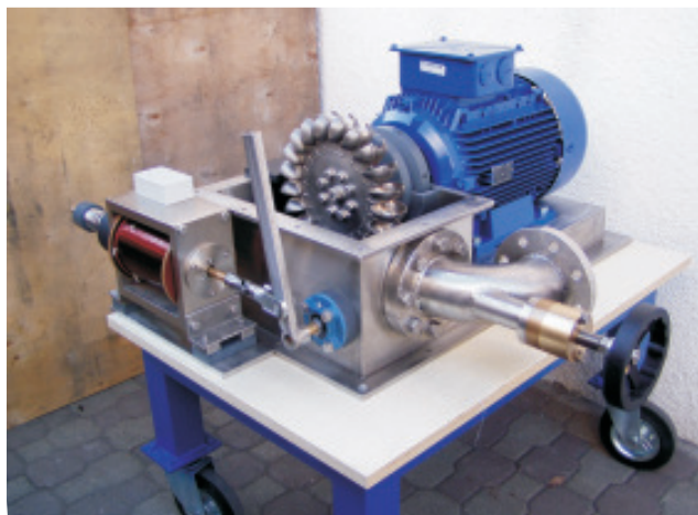
Turbine tipo Pelton con generatore asincrono 11 KW - 1500g/min. - 110m dislivello