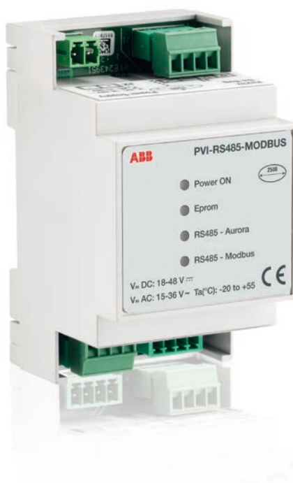
ABB monitoraggio e comunicazione PVI-RS485-MODBUS Converter

La famiglia di dispositivi PVI-RS485-MODBUS di ABB consentono di convertire il protocollo proprietario Aurora Protocol in protocolli di comunicazioni di tipo ModBus RTU o ModBus TCP.