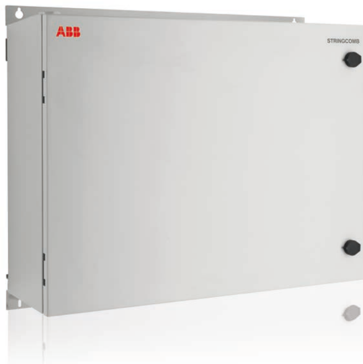
ABB monitoraggio e comunicazione STRINGCOMB-150

Lo string combiner STRINGCOMB, è un complemento ideale per gli inverter ad uso commerciale ed utility.