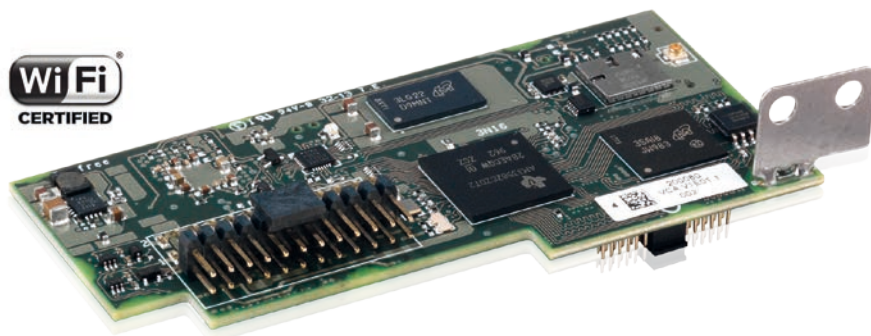
ABB monitoraggio e comunicazione VSN300 Wifi Logger Card

La nuova VSN300 Wifi Logger Card è una scheda di espansione per gli inverter di stringa UNO e TRIO di ABB, che offre ai proprietari di installazioni residenziali e commerciali una soluzione avanzata e conveniente per il monitoraggio e il controllo del loro impianto fotovoltaico.