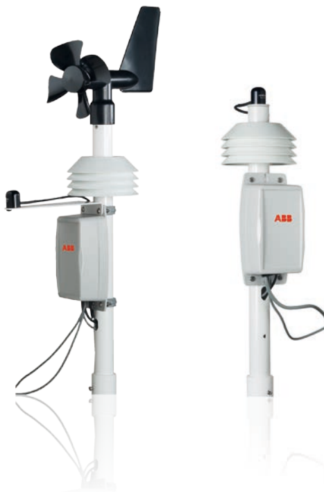
ABB monitoraggio e comunicazione VSN800 Weather Station

La VSN800 Weather Station monitorizza automaticamente le condizioni atmosferiche del sito e la temperatura del pannello fotovoltaico in tempo reale trasmettendo le misurazioni effettuate dai sensori ad Aurora Vision® Plant Management Platform.