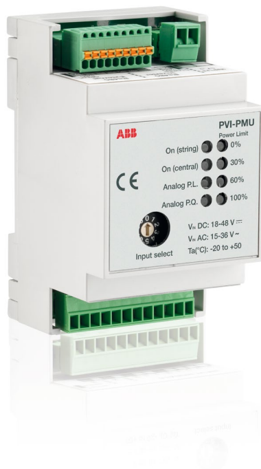
ABB monitoraggio e comunicazione PVI-PMU

PVI-PMU di ABB permette agli utenti di controllare la potenza attiva e reattiva degli inverter in accordo con le normative EEG-2009§6 e BDEW.