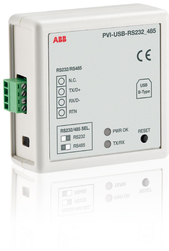
ABB monitoraggio e comunicazione PVI-USB-RS232_485 Converter

Un dispositivo essenziale che consente all'utente di connettere tutti gli inverter ABB ad un pc tramite ingresso RS485.