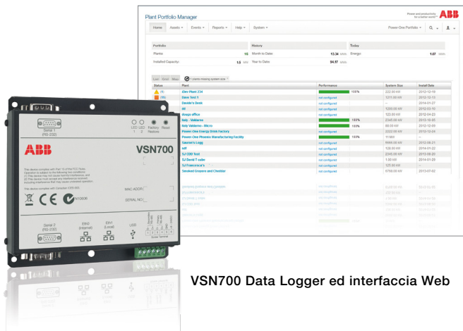
VSN700 Data Logger ed interfaccia Web