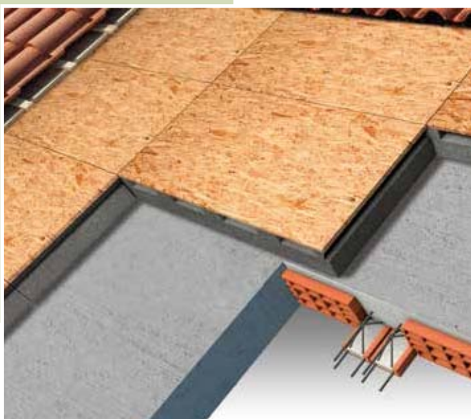
Isolamento per copertura a falda inclinata con struttura in latero-cemento