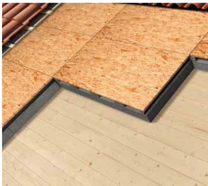
Isolamento per copertura a falda inclinata con struttura in legno