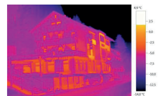
Immagine termica con testo ScaleAssist