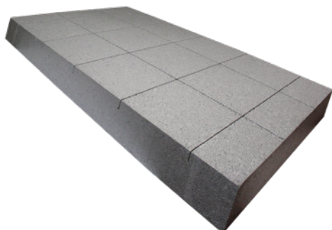
Faccia esterna detensionata

La lastra di colore grigio argento presenta dei tagli detensionanti incrociati sulla faccia esterna dove verrà eseguita la rasatura armata uniformante. La presenza di questi tagli migliora la stabilità dimensionale della lastra e riduce le tensioni indotte dai cicli termici. La lastra in EPS SILVERTECH 031 grazie ad una goffratura superficiale a disegno regolare sulla faccia interna, rende intuitiva la modalità di incollaggio e aumenta la superficie utile per l'adesione del collante.