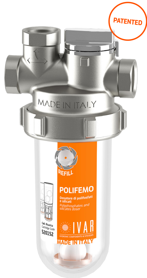
POLIFEMO PLUS with stop water system

L'UNICO dosatore che: PROTEGGE da CALCARE PROTEGGE dalla CORROSIONE FILTRA le impurità