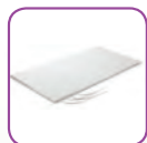
Uponor Lastra Soffitto