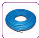
Uponor pePEX Q&E Clima