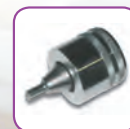
Uponor Q&E Testa