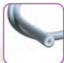
Uponor Nastro Isolante per Raccordi