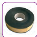
Uponor Isolamento per Tubi 9,9