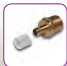
Uponor Raccordi Q&E