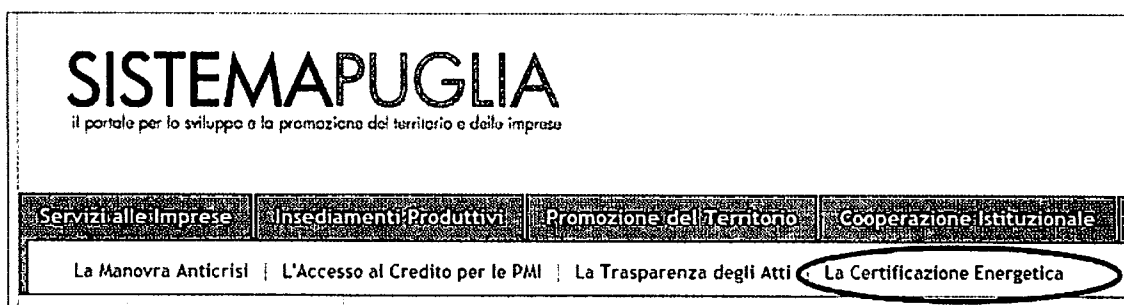
Figura 1 - Punto di accesso alla sezione La Certificazione Energetica

La procedura è disponibile nella pagina La Certificazione Energetica - link posto nella barra di menu orizzontale di secondo livello della home del portale.