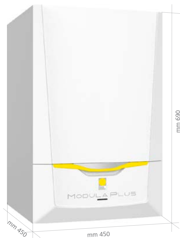
(Misure versione Modula Plus S/DS/C)

La gestione climatica avviene attraverso una sonda esterna che permette alla caldaia di minimizzare i consumi di gas metano. Lo scambiatore in alluminio silicio mantiene le performance della caldaia elevate, anche quando la caldaia è installata in impianti ad alta temperatura. Per ottenere la classe energetica A+ ed accedere alle detrazioni fiscali è sufficiente abbinare una regolazione Paradigma.