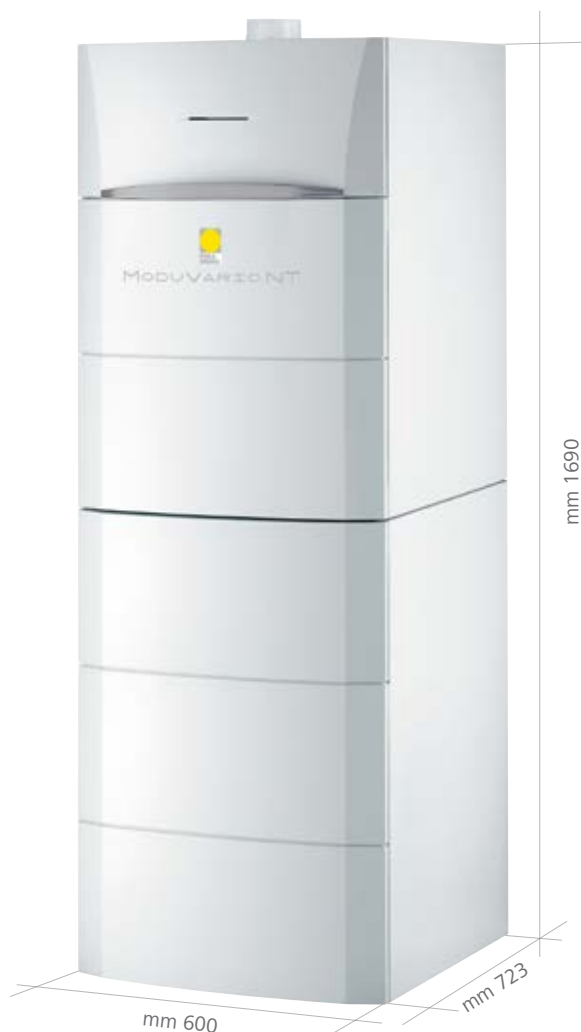
Assemblaggio in verticale

ModuVario NT è ideale per abitazioni di medie grandi dimensioni, con elevato fabbisogno di acqua calda sanitaria. Configurata per la produzione di acqua calda sanitaria e riscaldamento, la caldaia è dotata di predisposizione al solare termico. È abbinabile a bollitore da 100 o 160 litri per soddisfare le diverse esigenze. È assemblabile in verticale e in orizzontale per adattarsi ai differenti spazi abitativi. Per ottenere la classe energetica A+ ed accedere alle detrazioni fiscali è sufficiente abbinare una regolazione Paradigma.